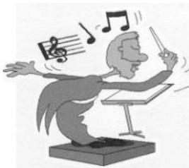
GV Edelweiß Peesten

Weihnachtsfeier am 24.12. zur späten Stunde an der Tanzlinde.